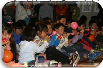
↑: ブービー笛を体験する参加者

ストロー、アルミパイプ、グラスハーブ(ワイングラスに水を入れたもの)など、身近にあるものを使い、音のしくみ、音階のしくみなど、音のふしぎにせまりました。