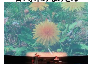
↑↓: 星空散歩ライブの様子