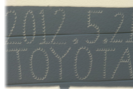
↑段ボールのピンホール