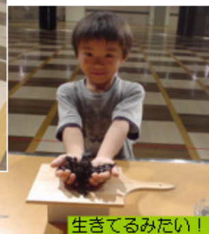
生きてるみたい！ 磁石がニョギニョギ。