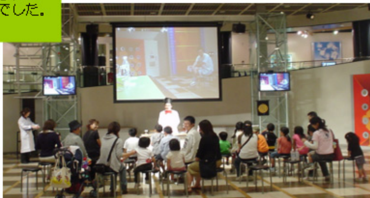
科学体験館には、サイエンスショー専用のホールがあります。